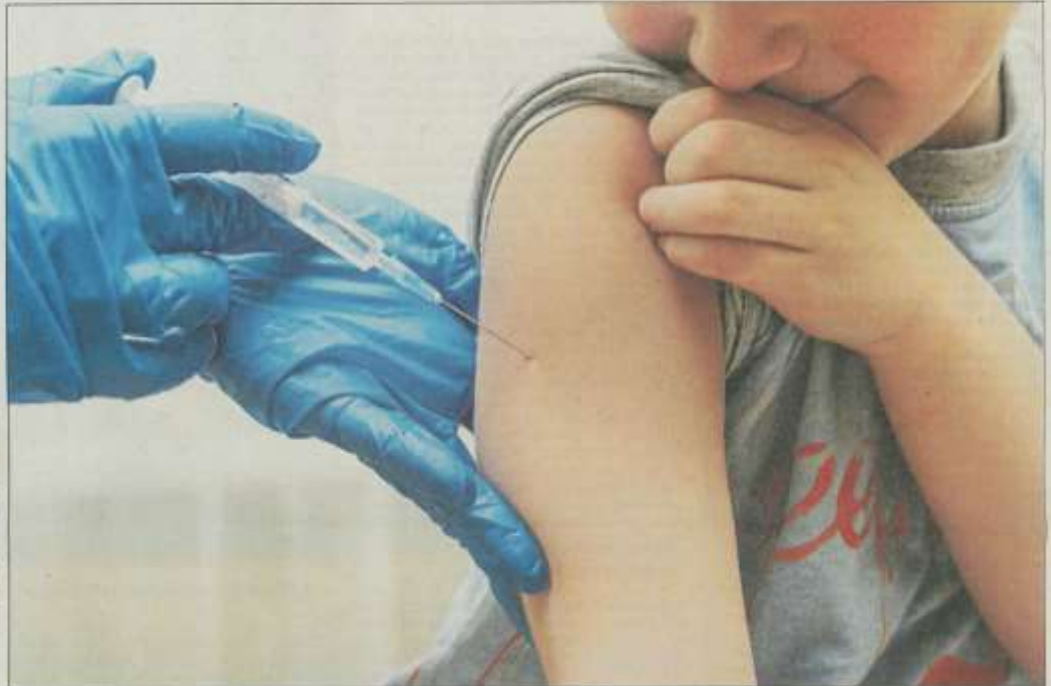
Masern sind hoch ansteckend. Ein kleiner Pickel kann sie verhindern.

Anderer die Stimmung beim Waldorfkindergarten in Neustadt. Hier obliegt es dem